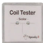
Coil Tester x 1