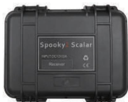
Receiver Box x 1