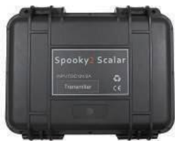
Transmitter Box x 1