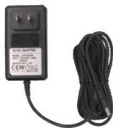
Power Cable x 1