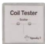
Coil Tester x 1