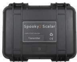
Transmitter Box x 1