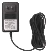
Power Cable x 1