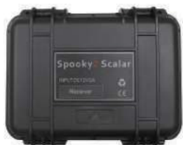
Receiver Box x 1